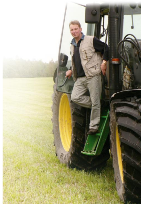
Arkivbild: riksdagsledamot Mats Nylund